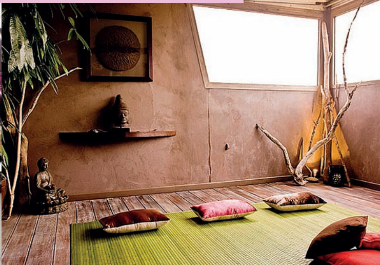
Le temps d'une parenthèse.